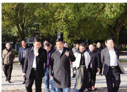
湖北松滋市一中考察团来校参观交流