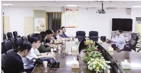
北京“情系远山”公益基金会座谈

6月18日,北京“情系远山”公益基金会一行9人来到常德市石门县第一中学进行调研、考察。