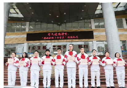
“感动校园”十大学生