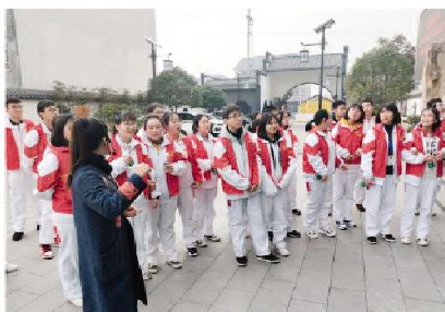
我校志愿者在逸逸阁书院参观