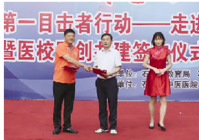
“医校同创共建”签约仪式