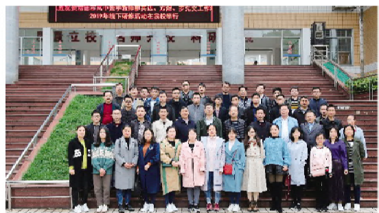
常德市三个数学工作坊全体成员合影留念

此次集中研修,聚焦主题,成果丰硕。不少学员表示,要让工作坊研修成为一种新的学习方式,边教学边学习,做一名学习型的教师,努力提升自己的教育教学能力。