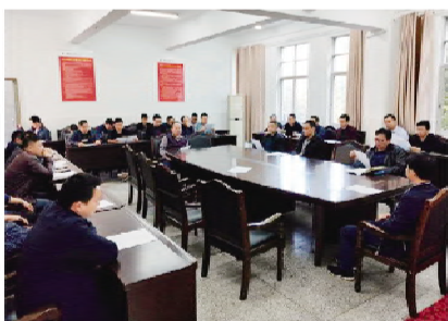
“德育活动大家访”启动仪式会场